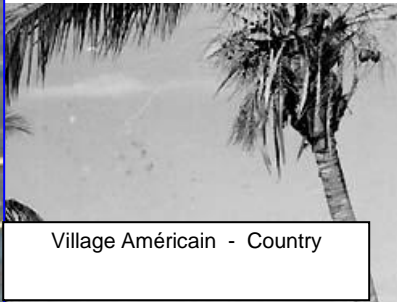
Village Américain - Country