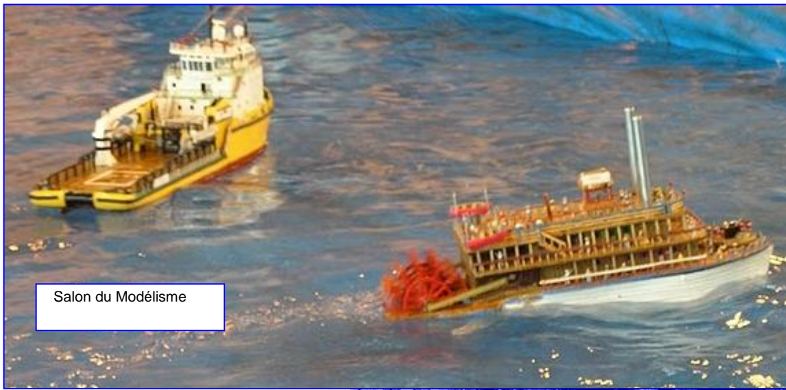
Salon du Modélisme